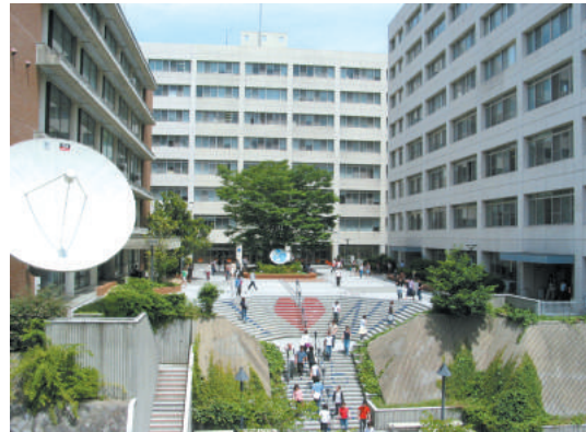
大阪大学箕面キャンパス Osaka University Minoh Campus