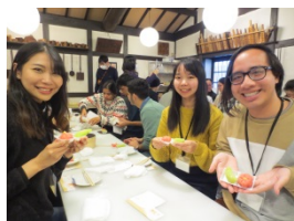
2月和菓子作り体験

単位認定・単位互換については、学生の出身大学の判断に委ねています。出身大学での単位認定が必要な場合は、具体的なカリキュラムの内容について、申請を行う前にメール等で問い合わせてください。