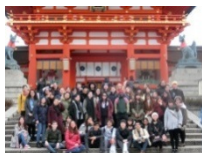
2月見学旅行 伏見稲荷大社

2020年：留学生数 2,611人、日研生 36人 2019年：留学生数 2,594人、日研生 40人 2018年：留学生数 2,480人、日研生 40人