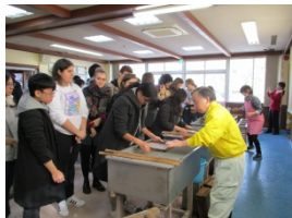
11月見学旅行 紙漉き体験