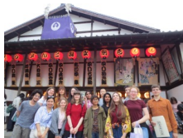
4月見学旅行 こんぴら歌舞伎鑑賞