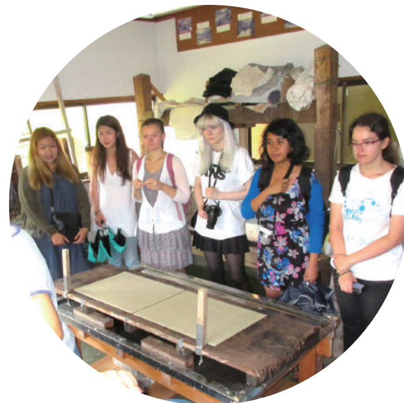
日本文化を体験する機会がたくさんあります。 You'll have many opportunities to experience Japanese culture!