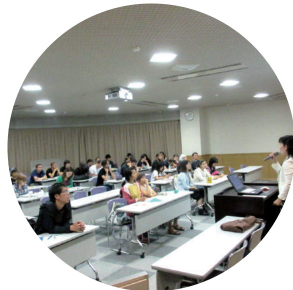
体験旅行へ行く前には、関連の講義が開かれます。 Before each cultural experience field trip, a related seminar is held.

In the fall semester of 2016, Maple Program students could choose from a total of 150 electives. In the spring semester close to another 150 electives were provided. On top of that, day trips and two-day excursions are organized as a part of the Special Seminar on Japanese Language and Culture. Such opportunities to experience Japanese society help you deepen your intercultural understanding. Furthermore, you can always rely on your Japanese tutor, a fellow Osaka University student, who will support you throughout the year. If you wish to specialize in Japanese language and culture, all these elements combined make the Maple Program the perfect course to pursue your academic goals.