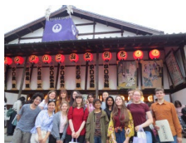
こんぴら歌舞伎鑑賞