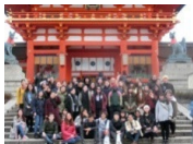
伏見稲荷大社見学